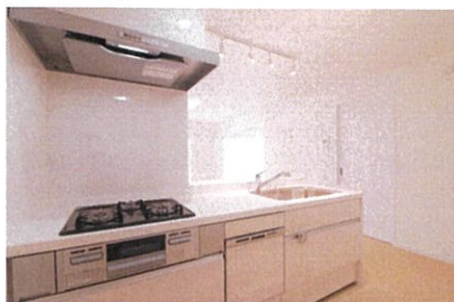
キッチン システムキッチン是新調されています 食洗機もついて便利です